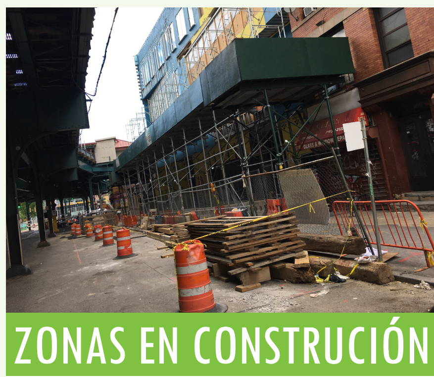
ZONAS EN CONSTRUCCIÓN