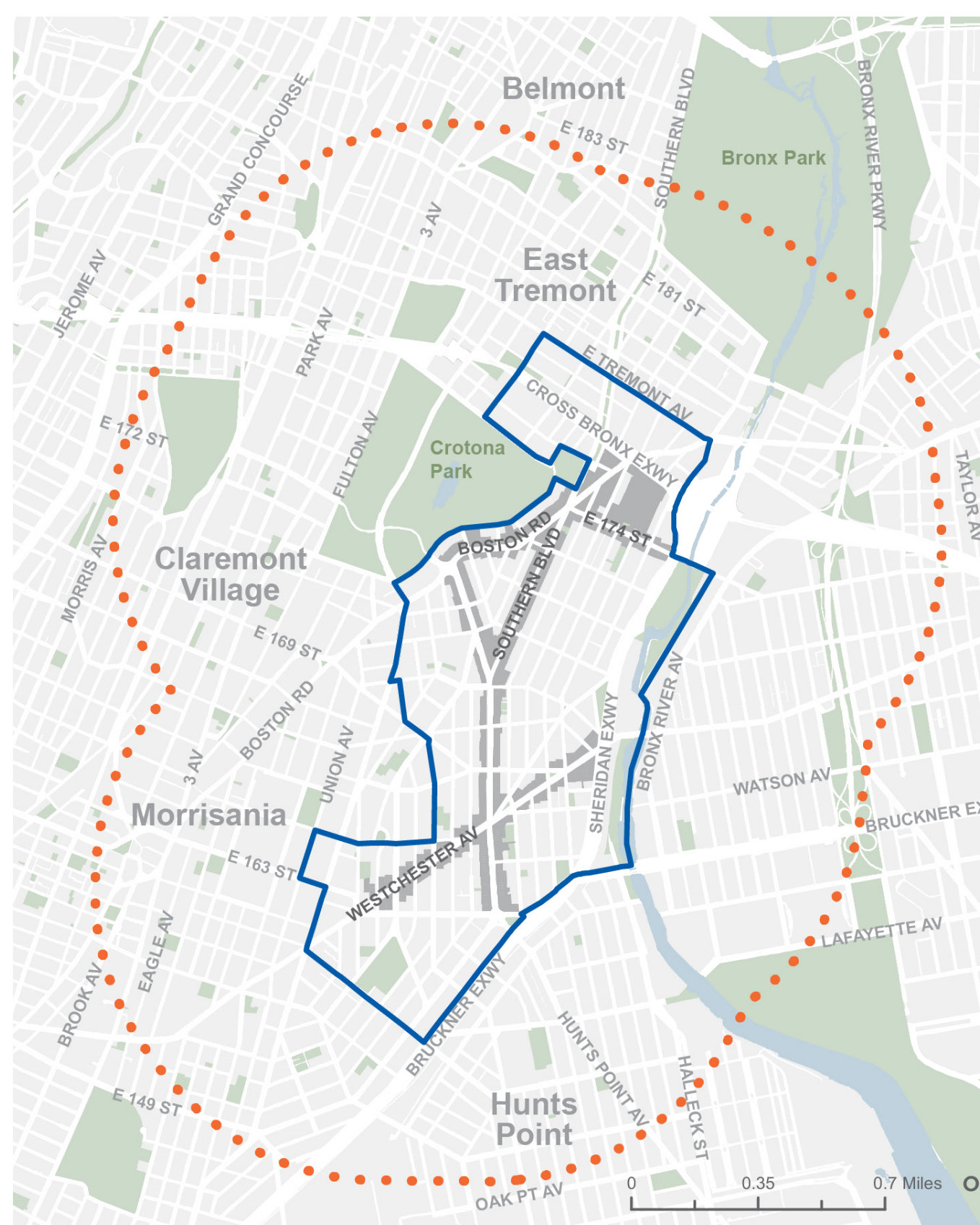
Área del Estudio Comercial