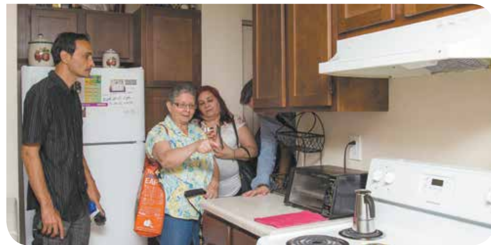
Los residentes de Betances visitan una cocina renovada en un apartamento del residencial Bronxchester houses.