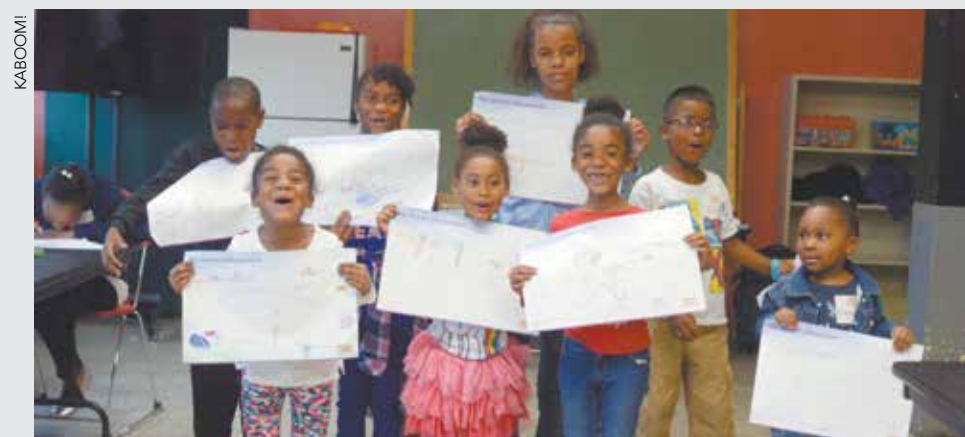
Los diseñadores jóvenes muestran sus planes para columpios, toboganes, y mucho más.

el residencial Pomonok Houses el sábado 4 de noviembre. La financiación aportada por JetBlue y Playword permite que NYCHA, el Fondo para la Vivienda Pública y nuestro socio de juegos de NYCHA de NuevaGeneración, KaBoom, construyan el primero de lo que se espera que sean muchos patios de juegos diseñados por niños en los residenciales de NYCHA.