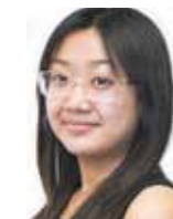
Stella Tse Vladeck Houses Hunter College, Educación

“Mi hermano siempre ha sido mi inspiración. Sufrió un grave accidente de motocicleta en el que se rompió los brazos y las piernas, se le perforó la espalda, pero no dejó que esto lo detuviera. Siguió trabajando duro y ahora asiste a la escuela para conseguir su licenciatura para poder ser un enfermero registrado”.