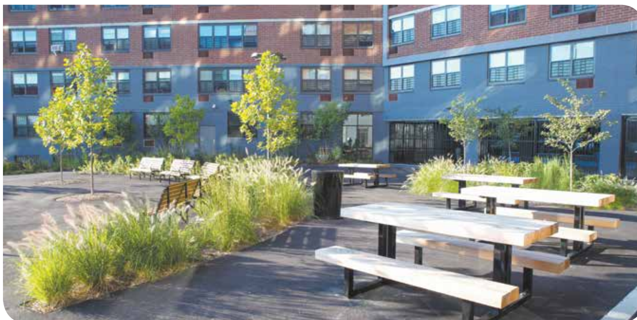
El espacio comunitario exterior renovado del residencial de Bronxchester Houses.