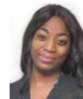
Hatumata Gumane Morris Houses City College of New York, Inglés

"NYCHA es mi red de seguridad. Crecí en el residencial Fulton Houses con una madre soltera, pero todas las señoras cuidaron de mí. No tengo solamente un gran recuerdo: la sensación de camaradería general de todos los que vivimos en NYCHA es lo que más destaco".