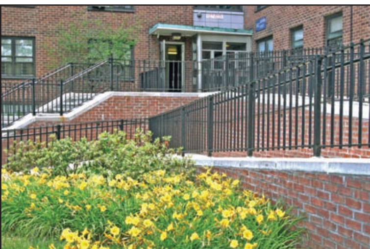
Las rampas en la entrada de Boulevard Houses en Brooklyn facilitan el acceso a las personas con dificultades de movilidad.

Para obtener más información, comuníquese con su Asistente de Vivienda u Oficina de Administración, o llame a los Servicios para Personas con Discapacidades del Departamento de Igualdad de Oportunidades al (212) 306-4652 o TDD (Dispositivo de Telecomunicación para Sordos) al (212) 206-4445.