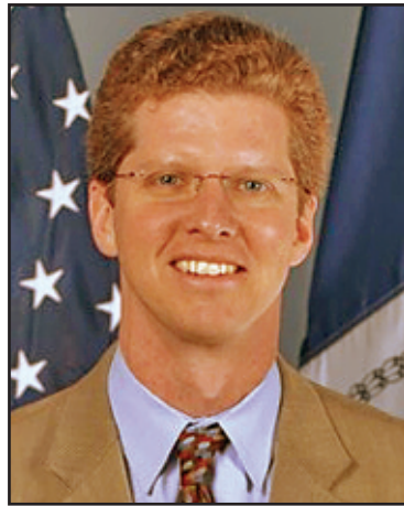
Secretario de HUD Shaun Donovan

EL 22 DE ENERO DE 2009, EL SENADO DE LOS ESTADOS UNIDOS CONFIRMÓ EL NOMBRAMIENTO DE SHAUN DONOVAN POR EL PRESIDENTE BARACK OBAMA COMO SECRETARIO DEL DEPARTAMENTO PARA LA VIVIENDA Y DESARROLLO URBANO (HUD SIGLAS EN INGLÉS). El Sr. Donovan es el ex Comisionado del Departamento para la Preservación y Desarrollo de la Vivienda (HPD siglas en inglés) de la Ciudad de Nueva York, la entidad que ha sido socio de la Autoridad de la Vivienda de la Ciudad de Nueva York (NYCHA) en un número de iniciativas de vivienda asequible bajo el plan del alcalde Michael R. Bloomberg.