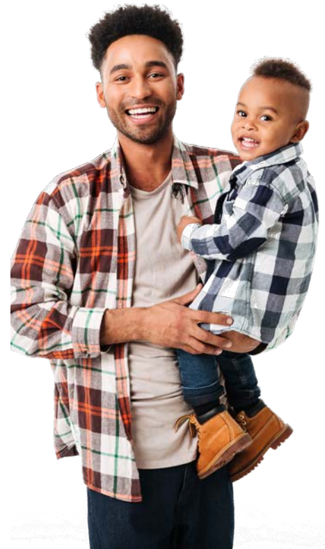
Photo for illustration purposes only. The people shown are models.