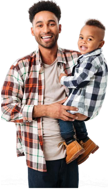
صرف مثال کے مقاصد کے لیے تصویریں۔ نظر آنے والے لوگ ماڈلز ہیں۔