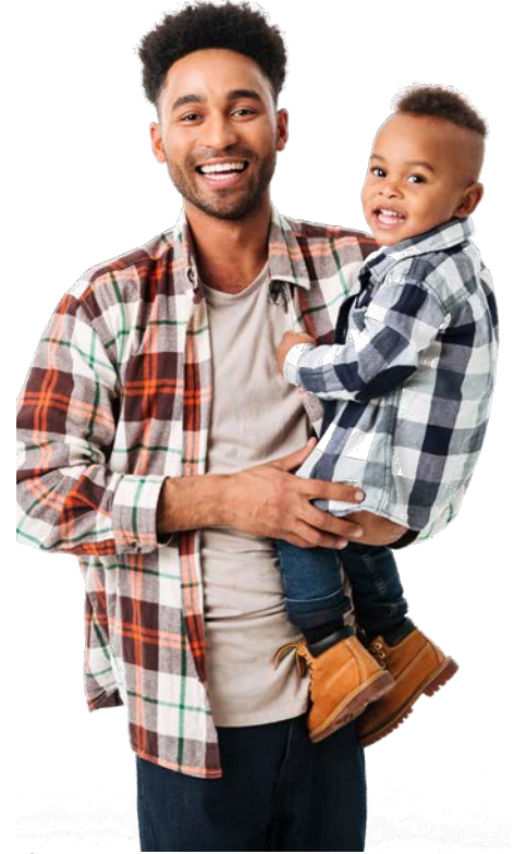
ছবিগুলো শুধুমাত্র বোঝাতে সাহায্যের জন্য। এখানে দেখানো লোকেরা মডেল।

আপনার শিশু সহায়তা ধারাবাহিকভাবে প্রদান করুন? আপনি অতিরিক্ত হ্রাসের জন্য যোগ্য হতে পারেন। 929-252-5200 নম্বরে ফোন করুন!