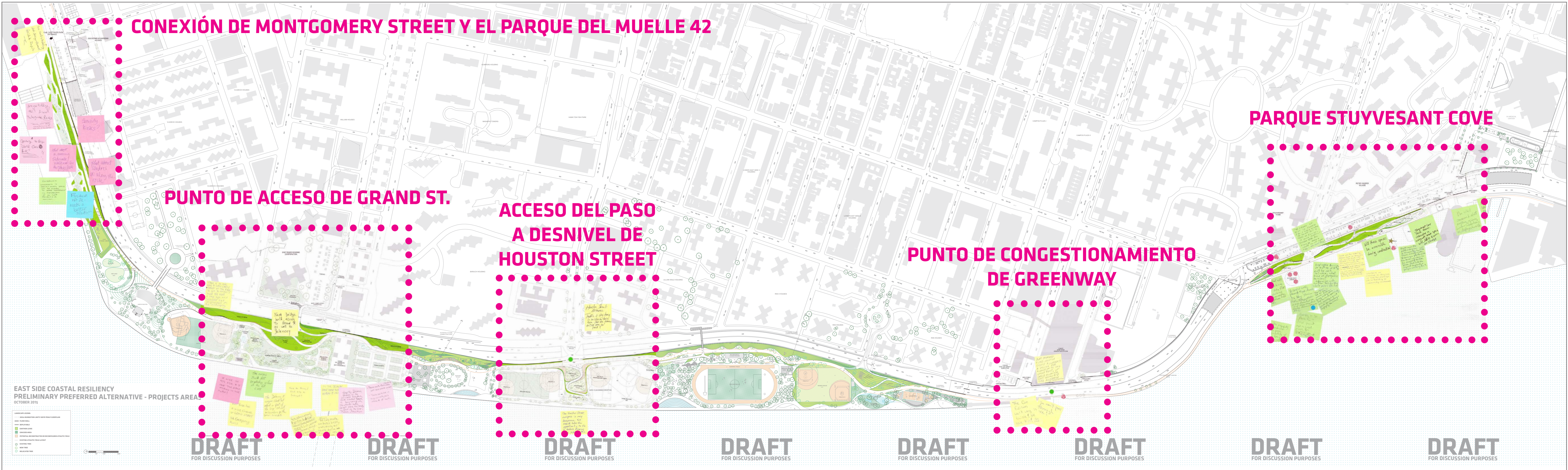
RETROALIMENTACIÓN DE LA COMUNIDAD SOBRE LA DIRECCIÓN INICIAL DE DISEÑO: ÁREAS DE ENFOQUE