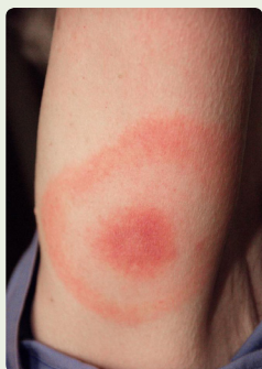
Sarpullido de eritema migratorio en una persona que tiene la enfermedad de Lyme.