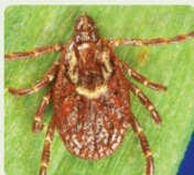
Garrapata americana del perro