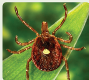
Garrapata estrella solitaria