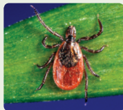
Garrapata de patas negras

La información y las imágenes que aparecen en esta tarjeta han sido adaptadas del Departamento de Salud del Estado de Nueva York y de los Centros para el Control y la Prevención de Enfermedades.