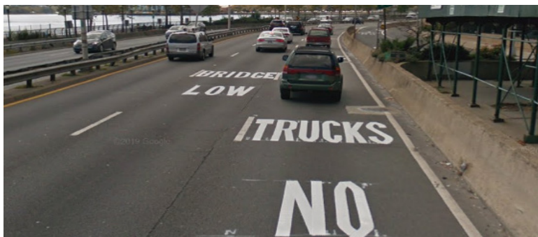
位於 FDR Drive 的車道標線