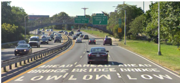
位於 Belt Parkway 的車道標線