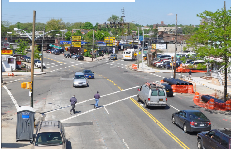
ACTUALMENTE: HILLSIDE AVE Y METROPOLITAN AVE