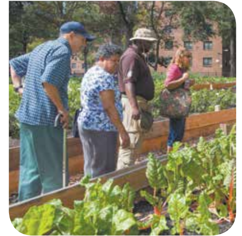
Miembros del Urban Farm Corps de Green City Force guían a los residentes jardineros de NYCHA durante un recorrido de la nueva granja en Bay View Houses.

de GCF y residente de Polo Grounds le dijo a todos los que asistieron a la actividad: “Pensé que tenía que ser famoso o millonario para ayudar a mi comunidad”, hasta que descubrió a Green City Force y aprendió y comenzó a prestar servicio como miembro del Urban Farm Corps .