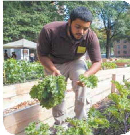
Un miembro del Urban Farm Corps de Green City Force recoje verduras frescas de la granja para una demostración y degustación.