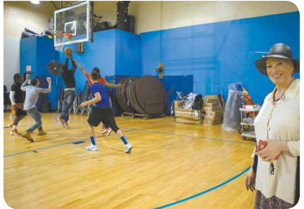
La "alcaldesa de Harlem" ve un animado y espontáneo juego de baloncesto en el centro comunitario.