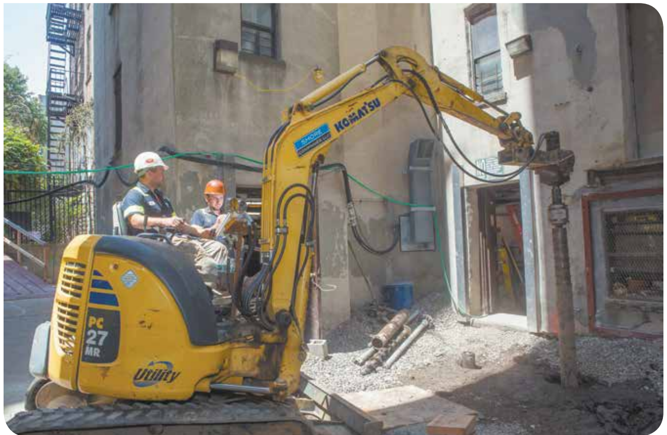
Proyecto de recuperación de Sandy en Lower East Side Rehab Grupo 5.

"En el aniversario del huracán Sandy, nos enorgullece anunciar que NYCHA ha realizado importantes progresos en las tareas de recuperación, (CONTINÚA EN LA PÁGINA 4)