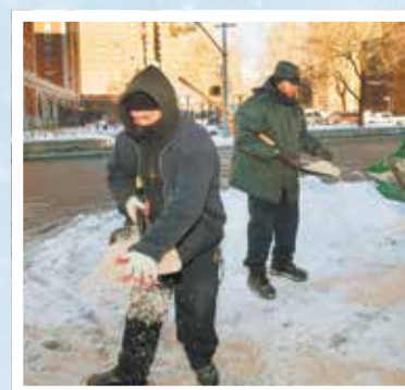
Los empleados de NYCHA esparcen arena sobre la acera del residencial Baruch Houses, con una vista del residencial Wald Houses en el fondo.