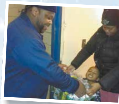
Los empleados de NYCHA recorren puerta por puerta el residencial de O'Dwyer para informar a los residentes cómo protegerse de las temperaturas muy bajas.