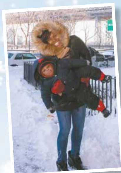
Esta residente de NYCHA se divierte en la nieve en el residencial Baruch Houses. Su hijo, no tanto.