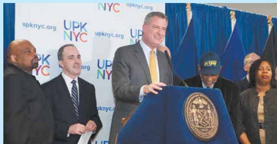
El alcalde Bill de Blasio habla durante una conferencia de prensa en el centro comunitario Johnson Houses.

Parte del compromiso del alcalde de Blasio con NYCHA queda claramente de