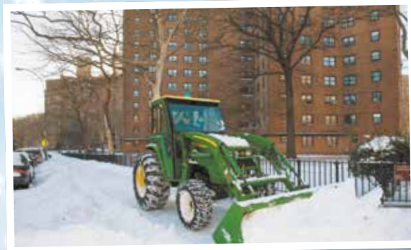
Un tractor de NYCHA quita la nieve de la acera frente al residencial Baruch Houses.