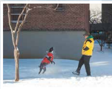
Lo que piensa un perro en el residencial Smith Houses: "Es sólo nieve. ¡Sacúdetela!"

Cuando en la noche del 6 de enero llegó a la ciudad de Nueva York lo que se llamó el "vórtice polar", y las temperaturas bajaron a niveles récord el día siguiente, NYCHA tomó medidas adicionales para asegurar la protección de los residentes. NYCHA estaba preparada con equipos adicionales de técnicos especialistas en sistemas de calefacción, plomeros y electricistas para responder a cualquier interrupción posible de la calefacción y el agua caliente o cualquier otra emergencia relacionada con el clima. Se instalaron protectores adicionales contra el frío en todos los edificios que tienen calderas portátiles, y se asignó personal para que estuviera presente en todo momento. Para asegurarse de que los residentes estuvieran informados sobre los riesgos del frío intenso, NYCHA colocó volantes con consejos de seguridad en sus 2,602 edificios de la ciudad, y publicó recomendaciones a través de las redes sociales.