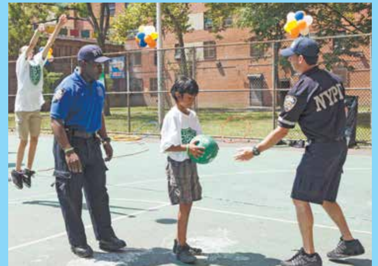
Un joven de NYCHA recibe consejos para tirar al canasto de oficiales de la NYPD, mientras otro joven hace un tiro a distancia detrás de él, durante la ceremonia de inauguración para el programa Play Streets de la Liga Atlética de la Policía en el residencial Grant Houses, el 29 de julio de 2013.

Los jóvenes de NYCHA tuvieron la oportunidad este verano de disfrutar de la alianza entre NYCHA y la Liga Atlética de la Policía (Police Athletic League - PAL). El programa Play Streets de PAL se llevó a cabo en 10 residenciales, con actividades orientadas a la prevención, la educación, los deportes, los juegos y el arte y la cultura. El programa cierra calles y otras áreas públicas para que los niños de seis a 16 años gocen de lugares seguros, supervisados y divertidos para jugar y aprender durante los meses de verano.