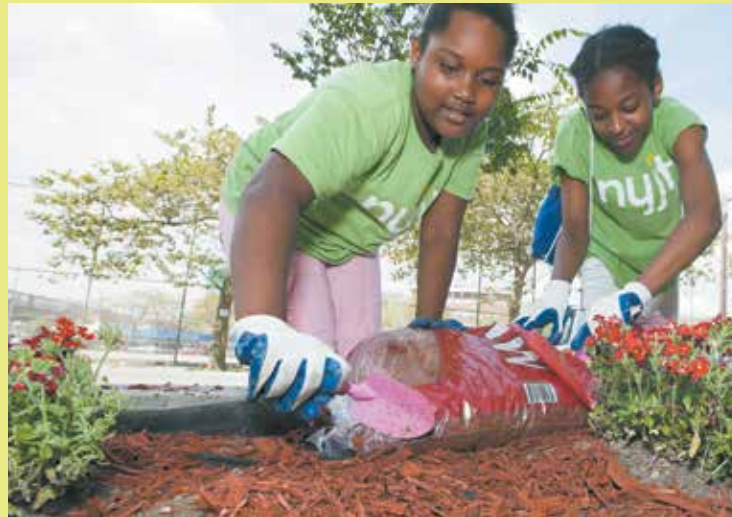
Jóvenes de NYCHA plantan flores durante un evento de recuperación después del huracán Sandy en el residencial Ocean Bay Houses, el 31 de julio de 2013.