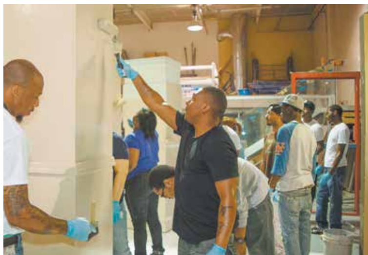
Residentes de NYCHA son adiestrados como parte del programa de capacitación para ser Aprendiz de Pintor de la Autoridad.

Todos los candidatos deben ser residentes autorizados de NYCHA, tener por lo menos 18 años de edad, aprobar una prueba de drogas y contar con un diploma de la escuela secundaria o estar en el proceso de obtener un diploma de equivalencia de la escuela secundaria (GED, por sus siglas en inglés). Los partici-