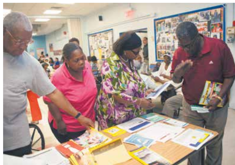
Personas de la tercera edad de NYCHA recogen información durante una sesión de preparación ante emergencias en el residencial Queensbridge North Houses, el 1 de agosto de 2013.

Algunas personas mayores de NYCHA están ahora mejor preparadas ante una emergencia, gracias a la capacitación que recibieron de la Oficina de Gestión de Emergencias de la Ciudad (OEM: Office of Emergency Management). Como parte de los esfuerzos de NYCHA para alentar a los residentes durante la temporada de huracanes a tener un plan de evacuación, reunir las provisiones de emergencia y mantenerse informados sobre los riesgos, OEM ofreció programas de capacitación este verano a los residentes de la tercera edad sobre preparación ante emergencias. Se organizaron reuniones en cada distrito: en el residencial Justice Sonia Sotomayor Houses en el Bronx, el residencial Seth Low Houses en Brooklyn, el residencial Stanley Isaacs Houses en Manhattan, el residencial Queensbridge North Houses en Queens y el residencial West Brighton Houses en Staten Island. NYCHA ofreció servicio de interpretación en chino, coreano, ruso y español. Para los aspectos principales evaluados durante la capacitación, vea el gráfico en la página 6. Para más información visite nyc.gov/oem o on.nyc.gov/emergencynycha .