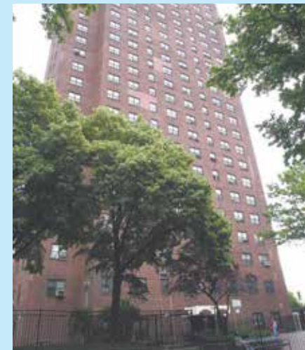
Kingsborough Extension es uno de los primeros residenciales que contará con reparaciones hechas con los $732 millones de financiamiento obtenidos por NYCHA a través de una nueva emisión de bonos.

Todo este trabajo a beneficio de las familias de NYCHA reafirma el compromiso central de la Autoridad de proporcionar viviendas seguras y económicas en buenas condiciones. También da continuidad a nuestro compromiso de