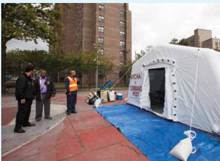
Empleados de NYCHA prueban una de las nuevas casas de campaña portátiles que la Autoridad adquirió para poder establecer puestos de mando móviles en los residenciales durante una emergencia.

Después del huracán Sandy, NYCHA realizó un análisis amplio para determinar las mejores prácticas con respecto a la preparación y las respuestas. Una de las recomendaciones aportadas recientemente fue la compra de casas de campaña portátiles e inflables que se pueden montar en cualquier lugar. Las casas de campaña, que vienen con iluminación y una unidad portátil de calefacción, ventilación y aire acondicionado, permitirán a NYCHA establecer puestos de mando en sus edificios cuando se necesite.