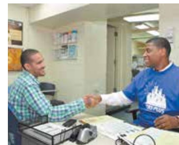
El programa Jobs-Plus ha sido un éxito en el residencial Jefferson Houses.

Houses en el Bronx; Armstrong I y II, Brownsville, Lafayette, Marcy y Van Dyke I Houses en Brooklyn; Wald y Riis II Houses en Manhattan; Astoria Houses en Queens; y Mariner's Harbor, Stapleton, Todt Hill, South Beach, West Brighton I y Richmond Terrace Houses en Staten Island.