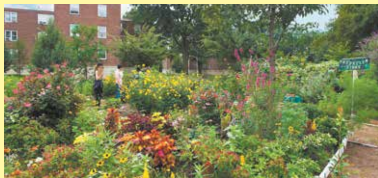
Ganador del mejor jardín de la ciudad Jardín Breukelen Sight en el residencial Breukelen Houses.