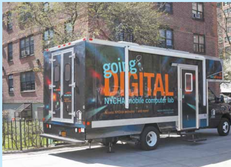
La nueva camioneta digital de NYCHA viaja por toda la ciudad para proveerle a los residentes acceso a computadoras portátiles, impresoras e Internet inalámbrico.

Las Camionetas Digitales establecen puentes para salvar las brechas tecnológicas