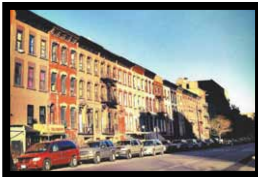
del residencial Johnson Houses

"Calle 115 en el residencial Johnson Houses en Manhattan"