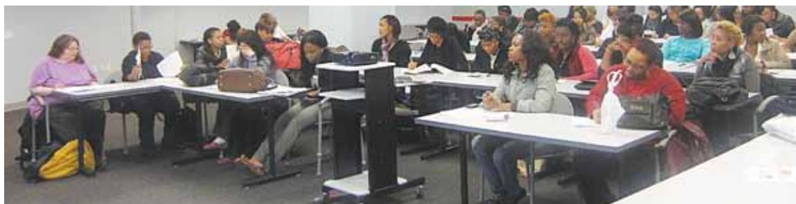
Residentes de NYCHA asisten al taller Plan de Acción para mi Negocio el 12 de abril de 2012.

Para obtener más información sobre esta y otras iniciativas de REES, llame a la línea directa de REES al (718) 289-8100 .