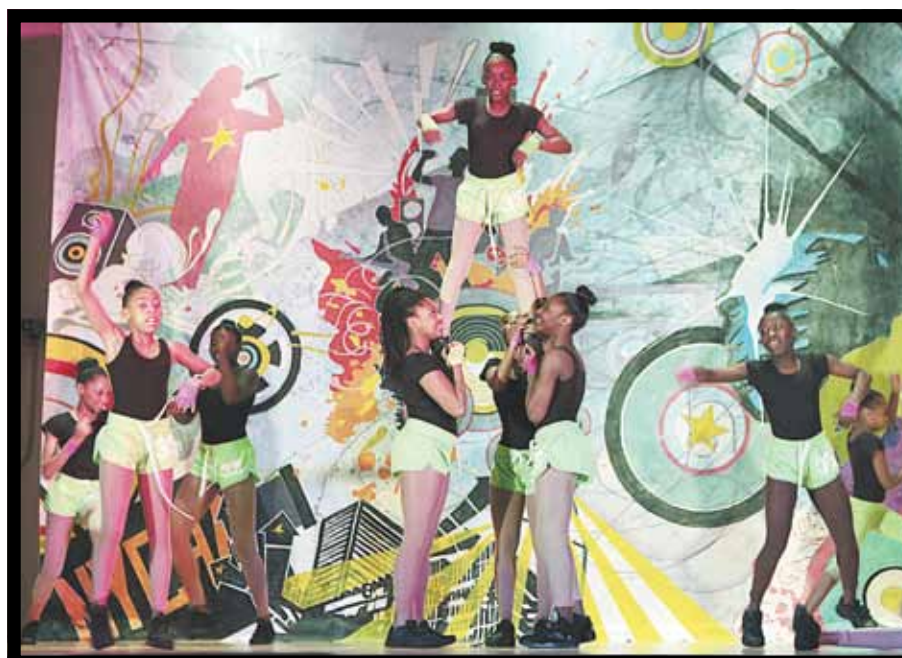
Somethin' Untouchable, Webster