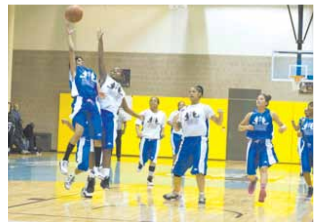
Los jóvenes de NYCHA, vestidos con uniformes donados por la marca de moda hip-hop ENYCE durante el Torneo Municipal de Baloncesto anual, el 5 de mayo de 2012.

Para obtener más información sobre los esfuerzos de NYCHA con respecto al deporte juvenil, lea el Mensaje del Presidente en la página 3.