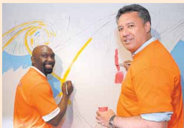
Mookie Wilson y Ron Darling, antiguos jugadores de los Mets, ayudan a pintar el Centro Comunitario de King Towers durante un evento de Brush with Kindness celebrado por NYCHA, Citi, la Asociación de Ex Miembros de los Mets presentada por Citi y Hábitat para la Humanidad de la Ciudad de Nueva York el 24 de mayo de 2012.