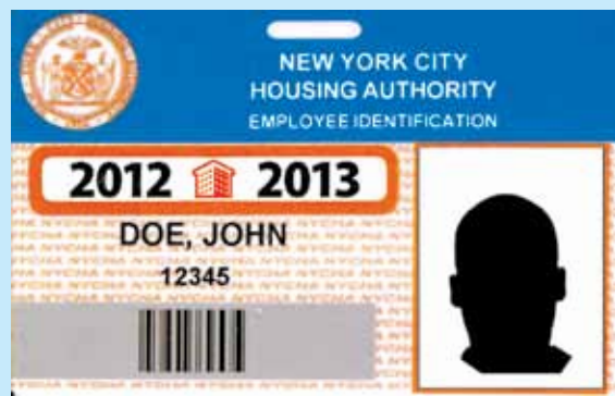
Una muestra de una tarjeta de identificación de NYCHA válida y actual.