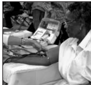
A una Señora se le toma la presión arterial durante la Feria.