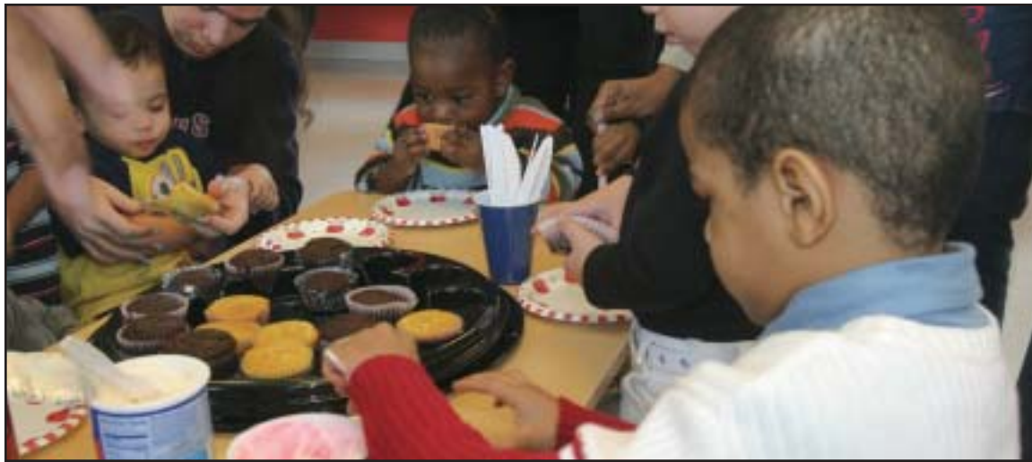
Decoración de Cupcakes envuelve destrezas que pueden ser retadoras para niños de edad pre-escolar. Los niños arriba acaban de completar el programa de ocho semanas de NYCELL en el Classic Center en Melrose Houses en el Bronx. Esta fue una de las actividades finales del día.

Programa Municipal que busca desarrollar las destrezas de Pre-Escolares