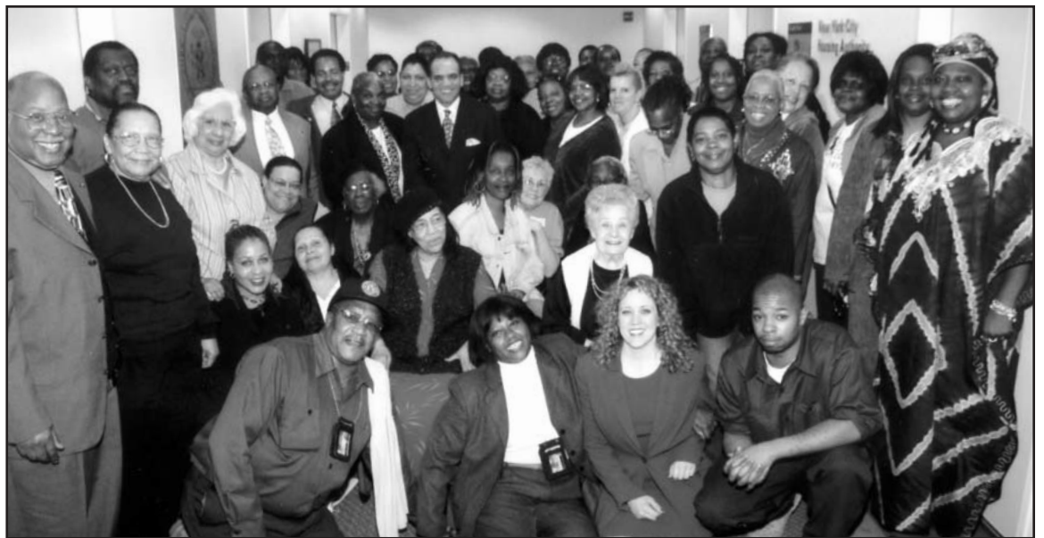
LA JUNTA del Concilio de Residentes posó para esta fotografía, junto con algunos miembros del personal, en la Oficina Central el 5 de mayo del 2004. Los 54 miembros de la Junta del Concilio de Residentes asiste a NYCHA con la creación de su Plan Anual, el cual trata asuntos administrativos por venir. El RAB se compone de 45 residenciales públicos y 9 residentes de Sección 8.