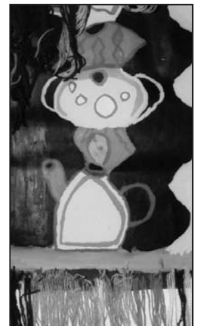
El proyecto “Group project” del Centro Comunal Bayview, edades de 8-12 años, “Salute to the First American Immigrant”. hilo/papel acrílico