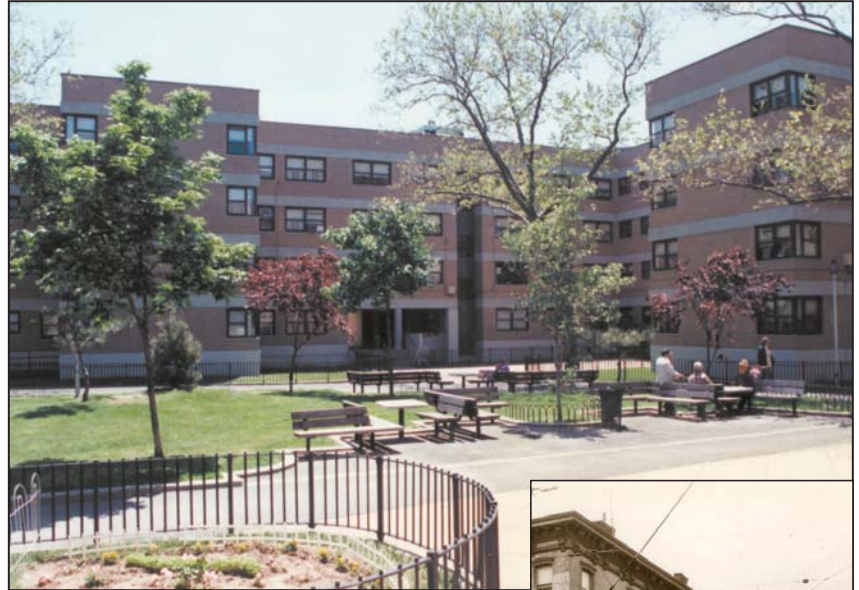
La Comisión de Preservación de Edificios Monumentos (Landmarks Preservation Commission) le otorgó a Williamsburg Houses en Brooklyn (arriba) el estatus de monumento el 24 de junio del 2003. La foto a la derecha muestra la esquina la avenida Bushwick en 1935 antes de que la construcción del residencial público comenzara.