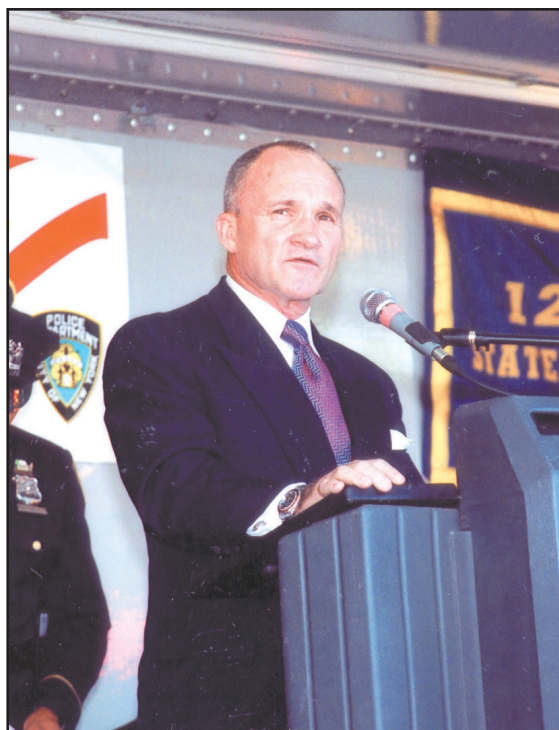
El Comisionado de la Policía Raymond W. Kelly.