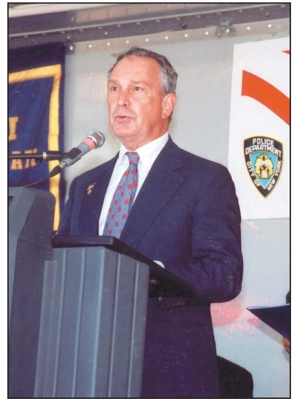
El alcalde Bloomberg en Staten Island.

El Departamento de Asuntos Comunes de la Autoridad de la Vivienda de la Ciudad de New York, (NYCHA siglas en inglés) y los Concejos Comunitarios de los cuarteles 122 y 120 del Departamento de la Policía de la Ciudad de New York fueron los anfitriones del evento. Dicho evento en Staten Island fue uno de diez colaboraciones entre NYCHA y NYPD en los cinco condados. Miles de neoyorquinos, cientos de organizaciones religiosas y cívicas,