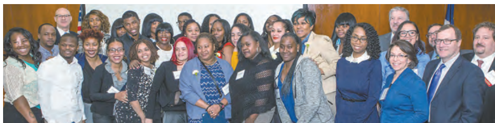
NYCHA celebró a la clase graduanda más reciente de la Academia de Adiestramiento de Residentes de NYCHA (NRTA) durante una ceremonia el 4 de marzo.

Para obtener información sobre la Academia de Capacitación de Residentes de NYCHA y otras oportunidades a través del Departamento de Empoderamiento Económico de Residentes y Sostenibilidad (REES, Department of Resident Economic Empowerment and Sustainability), comuníquese al 718.289.8100.