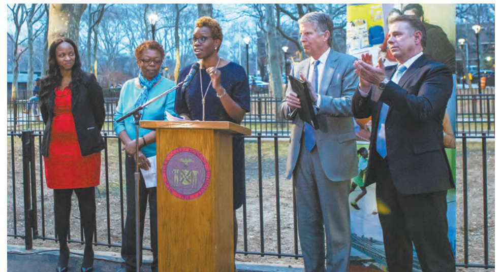
La Presidenta y Primera Ejecutiva Shola Olatoye en Polo Grounds Towers el 10 de marzo anunciando que el residencial recibió una inversión de $4.8 millones en iluminación nueva, incluyendo 341 luces instaladas en las entradas, las vías y los estacionamientos para que el residencial y el vecindario sean más seguros.

Ha comenzado la construcción de nuevas luminarias en otros ocho desarrollos: en el Bronx en Butler y Castle Hill Houses; en Brooklyn en Van Dyke 1 y Boulevard e Ingersoll Houses; en Manhattan en St. Nicholas Houses; y en Staten Island en Stapleton Houses. NYCHA espera que la mayor parte de la instalación de nuevas luminarias se complete en 13 de los 15 sitios de MAP al finalizar 2017. Las torres de iluminación temporales se mantendrán en donde están en los desarrollos hasta que se completen todos los proyectos.