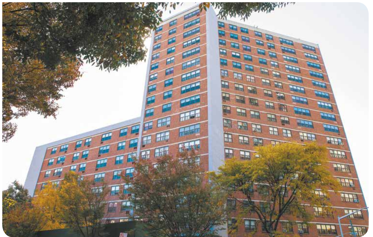
La nueva fachada de Bronxchester.