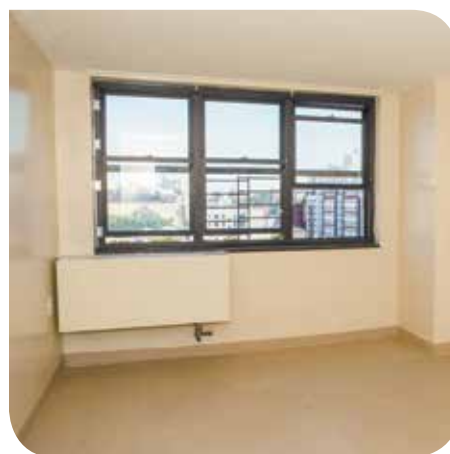
Ahora todos los apartamentos tienen nuevas ventanas y mosquiteros, además de unidades de aire acondicionado y calefacción que los inquilinos pueden controlar por sí mismos.