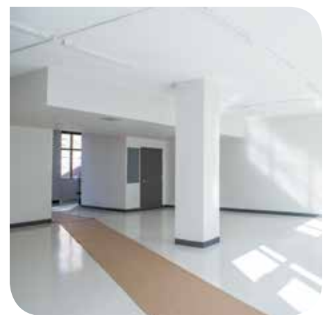
El salón de la Asociación de residentes, recientemente terminado, con una cocina completa.

las restauraciones en junio del 2015 y deberían terminarlas en diciembre. Las obras abarcan la renovación de la estructura exterior del edificio, mejorando la apariencia y aspecto de los exteriores; jardinería y asientos al aire libre, nuevos espacios de recreación y