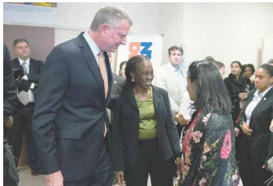
El Alcalde Bill de Blasio y la Primera Dama Chirlane McCray saludan a los presentes durante el comienzo del proyecto del Centro de Justicia Familiar en Staten Island.

La OCD actualmente dirige cuatro Centros de Justicia Familiar en NYC, el Bronx, Brooklyn, Manhattan y Queens. En total, han prestado servicios a 129,630 clientes y los visitaron 337,051 clientes durante los pasados diez años. Estos centros de atención sin cita previa proporcionan servicios gratuitos y confidenciales, entre ellos: representación legal en lo civil para causas de inmigración y Juzgado Familiar, enjuiciamiento de delitos de violencia doméstica, planificación de seguridad y evaluación de riesgo, asistencia con refugios de emergencia y vivienda,