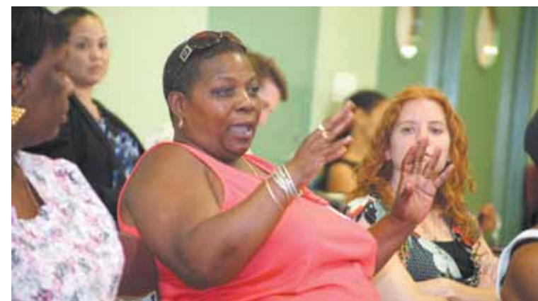
Una antigua residente de Prospect Plaza se dirige al público durante la más reciente reunión de progreso del plan Re-Vision Prospect Plaza Community Plan el 13 de julio de 2011.

"Durante el pasado año y medio hemos logrado mucho al trabajar con los residentes antiguos y los de la comunidad y se ha progresado bastante desde la última vez que nos reunimos", les