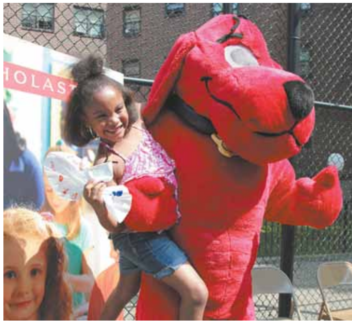
Clifford el Gran Perro Rojo levanta a una niña residente de NYCHA durante el lanzamiento del programa de alfabetización de verano “NYC Literacy Enterprise/NYCHA Reads” el 28 de junio de 2011.