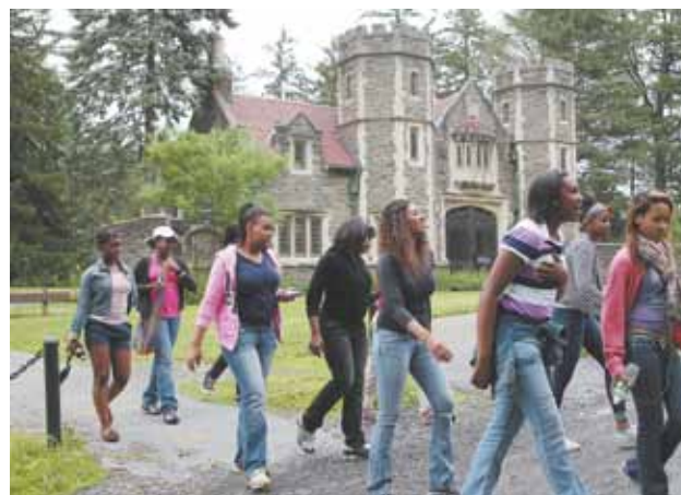
Las participantes de la Iniciativa de NYCHA/ FFAWN para Mujeres Adolescentes dan un paseo por el campus de Bard College en el norte de Nueva York durante el fin de semana de su graduación en junio.