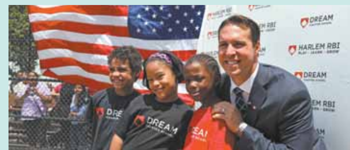
Mark Teixeira, primera base de los Yankees, se une a los niños durante la colocación de la primera piedra de la escuela autónoma DREAM de Harlem RBI en Washington Houses en Manhattan en junio.

Más viviendas asequibles llegan a Harlem como parte de un plan para tener una escuela autónoma en Washington Houses. La escuela autónoma Harlem RBI DREAM será de usos múltiples: un edificio de 13 pisos que incluye 90 unidades de vivienda asequible, la escuela y espacio para el programa Harlem RBI y sus oficinas.