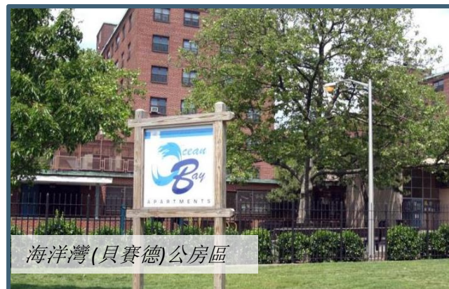
海洋灣(貝賽德)公房區

為在威科夫公房區和霍爾斯公房區的土地上建造的 800 套按 50/50 比例(平價和市價住房比例)分配的住房單位的工程發佈招標書(RFP)