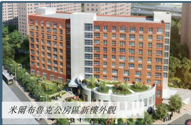
米爾布魯克公房區新樓外觀