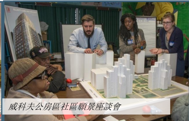
威科夫公房區社區願景座談會