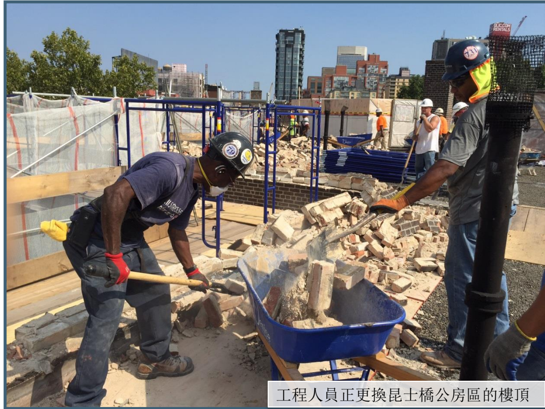
工程人員正更換昆士橋公房區的樓頂