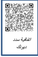
اتفاقية سدد ديونك

يمكنك الحصول على نسخة من اتفاقية برنامج سدد ديونك وتقديمها على النحو التالي: