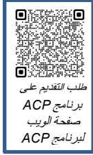
طلب التقديم على برنامج ACP صفحة الويب لبرنامج ACP

يمكنك تنزيل طلب التقديم على برنامج تخفيض المتأخرات من الرابط bit.ly/ArrearsCreditApp . قدمه كما هو موضح أعلاه مع طلب التقديم على برنامج سدد ديونك.