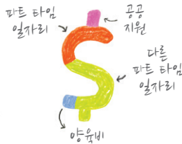
주택을 위한 소득 계산