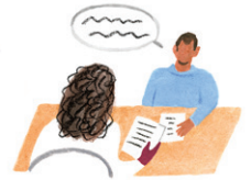
자격 증명 준비