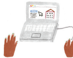
하우징 커넥트 (Housing Connect)로 주택 추첨 신청

주택 대사(Housing Ambassador)의 도움을 받으실 수 있습니다: