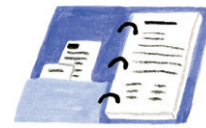
중요 정보 수집