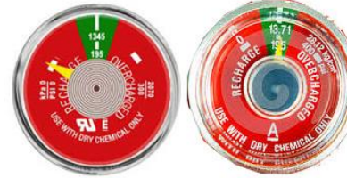
PFE এর একটি রচিত্র প্রয়োজন