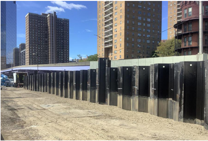
2022年10月，林荫路沿线的防洪墙板桩（活动3）