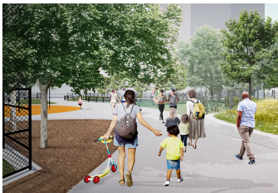
Murphy Brother 游乐场渲染图

ESCR团队于2022年10月19日成功举办了该项目的首次现场与我们合作 (Work With Us) 季度信息活动。(更多内容在第5页)