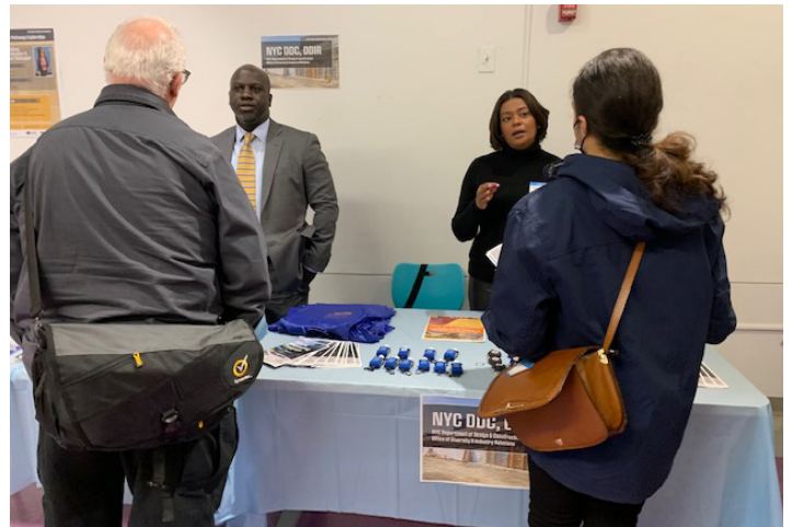
DDC ODIR于2022年10月19日在ESCR现场季度信息活动上

在本季度, ESCR团队还参加了2022年9月28日举行的 DDC东海岸韧性防洪峰会: 与团队见面 。项目管理和施工管理 (PMCM) 以及ESCR和BMCR (布鲁克林大桥-Montgomery海岸韧性防洪项目)的承包商团队在论坛上介绍了这些项目。该讲义可在ESCR网站上浏览。