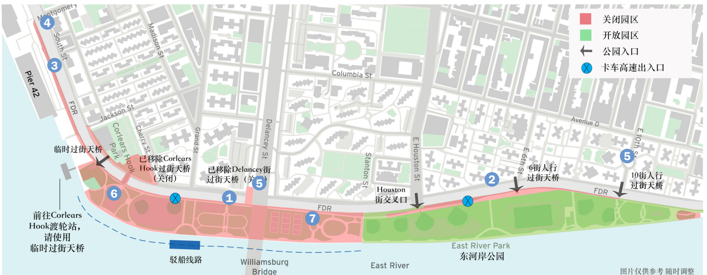
2022年8月项目区域1(PA1)的施工区域