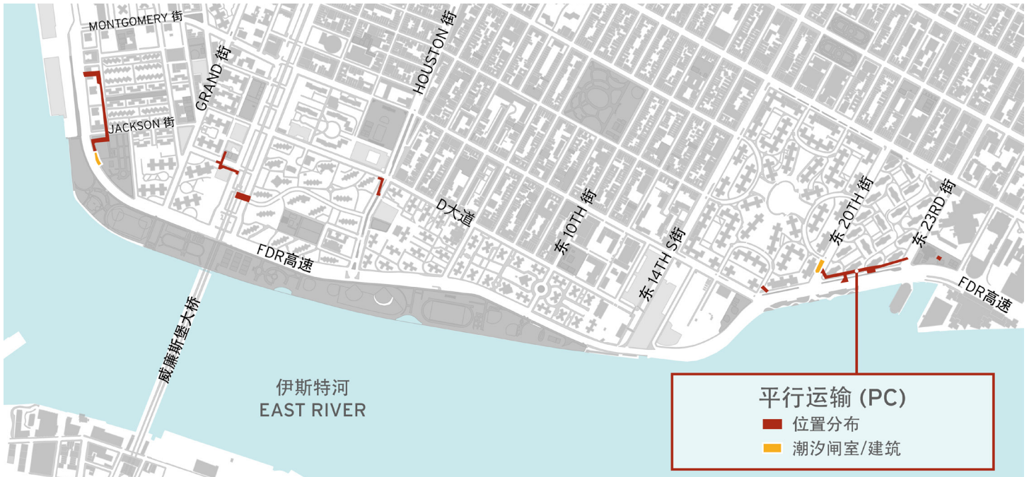
平行运输 (Parallel Conveyance, PC) 的项目区域