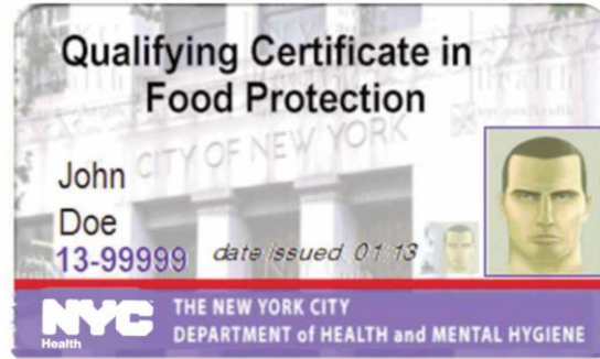
Food Protection Certificate