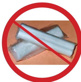
муравьиный мел от тараканов