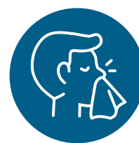
Nez qui coule ou nez bouché