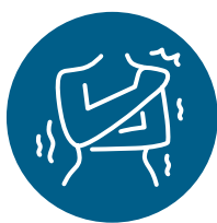
Douleurs musculaires ou corporelles