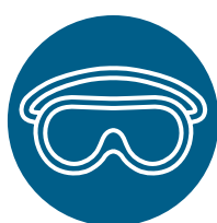
Lunettes de sécurité ou écran facial

Portez un équipement de protection individuelle (EPI) lors de la manipulation de volaille malade ou morte.