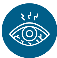
Yeux rouges, irrités ou larmoyants