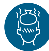
Fièvre ou frissons