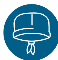
Couvre-chef ou couvre-cheveux