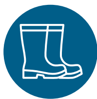
Chaussures et couvre-chaussures