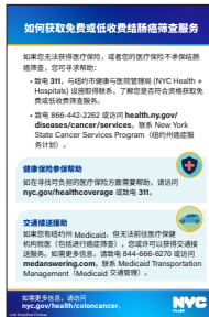
《如何获取免费或低收费结肠癌筛查服务》掌中卡