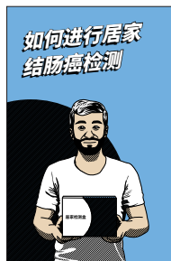
《如何进行居家结肠癌检测》图画故事