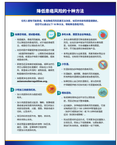
《降低患病风险的十种方法》信息说明