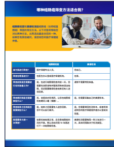
《哪种结肠癌筛查方法适合我？》信息说明