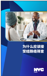
《为什么应该接受结肠癌筛查》手册

您可询问医疗保健提供者能否提供下列实用资源，也可以自行前往下列网站下载： nyc.gov/health/coloncancer 。