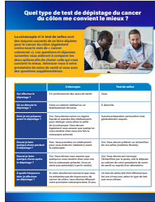
« Which Colon Cancer Screening Is Right for Me? » (Quel type de test de dépistage du cancer du côlon me convient le mieux ?) – Fiche d'information