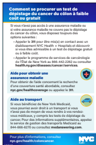
« How to Get Low- or No-Cost Colon Cancer Screening » (Comment se procurer un test de dépistage du cancer du côlon à faible coût ou gratuit) – Pense-bête