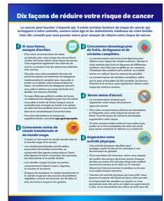
« Ten Ways to Lower Your Cancer Risk Fact Sheet » (Dix façons de réduire votre risque de cancer) – Fiche d'information