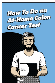
« How to Do an At-Home Colon Cancer Test » (Comment réaliser un test de dépistage du cancer du côlon à domicile) – Roman court