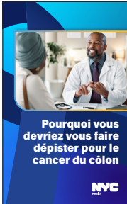
« Why You Should Get Screened for Colon Cancer » (Pourquoi vous devriez vous faire dépister pour le cancer du côlon) – Brochure

Demandez à votre prestataire de soins de santé s'il dispose de ces ressources utiles ou téléchargez-les à nyc.gov/health/coloncancer .