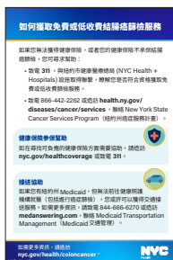
《如何獲取免費或低收費結腸癌篩檢服務》掌中卡