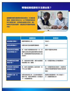
《哪種結腸癌篩檢方法適合我？》資訊說明