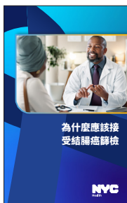
《為什麼應該接受結腸癌篩檢》手冊

您可詢問健康照護提供者能否提供下列實用資源，也可在此下載： nyc.gov/health/coloncancer 。