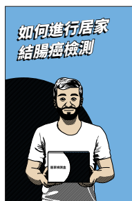
《如何進行居家結腸癌檢測》圖畫故事