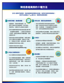
《降低患病風險的十種方法》資訊說明