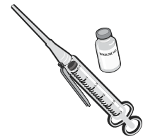
多步骤肌肉内注射器

*Evzio 自动注射器无需处方就能在 CVS、Duane Reade 和 Walgreens 购买。也可凭患者特定处方在其他药房购买 Evzio。