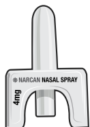
Назальный спрей для однократного применения

Существует четыре формы выпуска налоксона.