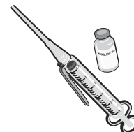
Препарат для внутримышечных инъекций для многократного применения

* Автоматический шприц Evzio® можно получить без рецепта в аптеках CVS, Duane Reade и Walgreens. Evzio также доступен в некоторых других аптеках, но только по индивидуальному рецепту.