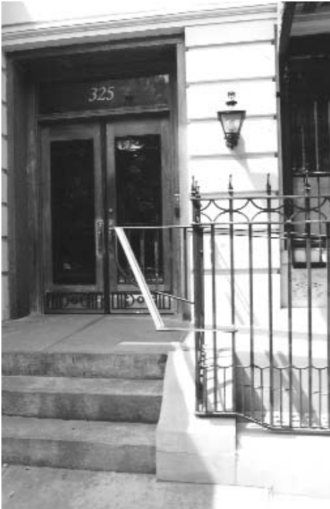
Une affaire récente, portée devant la Commission, a abouti à l'installation d'une rampe d'accès destinée à un locataire.

La Déclaration des Droits de l'homme de la Ville protège l'ensemble des résidents de New York contre toute discrimination. Que vous résidiez dans un appartement ou dans une maison individuelle, en coopération, en copropriété, dans un logement subventionné par le gouvernement ou dans un hôtel résidentiel, vous êtes couvert par la Loi. Cependant, en ce qui concerne les maisons à deux logements, la Loi ne prévoit pas de protection si le propriétaire, ou si un des membres de sa famille, occupe l'un des deux logements