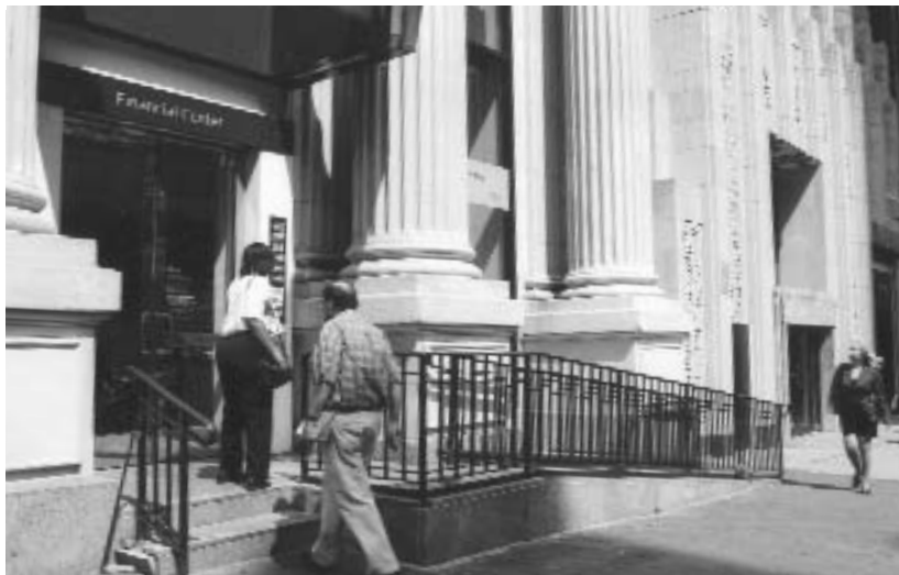
Une banque importante a récemment procédé à des modifications dans plusieurs agences pour faciliter l'accès aux personnes handicapées.

Il est formellement interdit par la Loi d'utiliser un questionnaire, de quelque forme que ce soit, pour procéder à la vente, à la location ou à la location