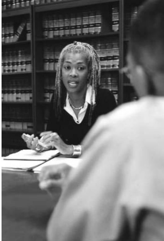
Un enquêteur du Bureau chargé de l'application de la Loi à la Commission s'entretient avec le plaignant au cours de la procédure d'admission.

En tant que personne handicapée, lorsque vous postulez à un emploi, votre futur employeur n'est pas autorisé à vous demander des compléments d'information concernant l'existence, la nature ou la gravité de votre handicap. Il peut néanmoins vous poser des questions relatives à votre capacité à exercer les fonctions spécifiques à l'emploi pour lequel vous postulez. L'employeur n'est pas autorisé à mener une enquête, ni à procéder à un examen médical sur vous, le candidat au poste, jusqu'à la proposition d'embauche définitive. Les examens médicaux des employés doivent être en lien direct avec les besoins professionnels de l'employeur.