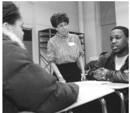
Le Programme de formation de la médiation par pairs enseigne aux étudiants la façon de résoudre des conflits entre eux.