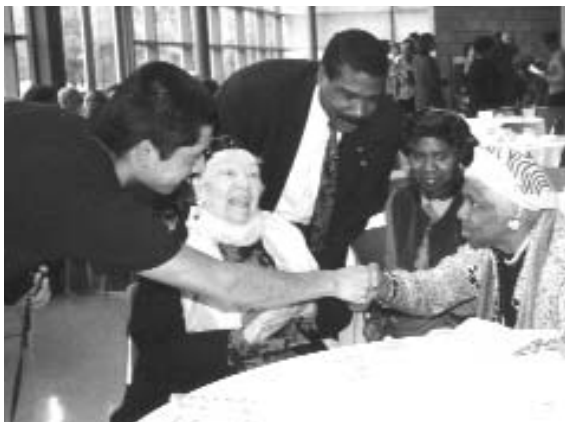
Les spécialistes des Droits de l'homme travaillant dans les divers Bureaux de la Commission participent régulièrement aux réunions et aux événements organisés par les différentes communautés.

personne en raison de sa race, de ses croyances, de sa couleur de peau, de sa nationalité ou de son pays d'origine, de son sexe (y compris son identité sexuelle), d'un handicap, de son orientation sexuelle, de sa condition ou de son statut social, de son état matrimonial ou de son âge, à moins de soupçons objectivement fondés.